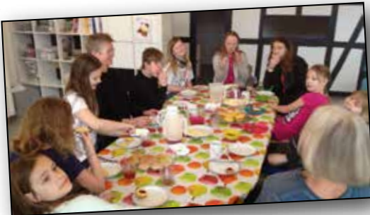
Et bord fuld af Løvsangere

Man er velkommen til at komme på besøg i koret, før man beslutter sig for, om man vil være med.