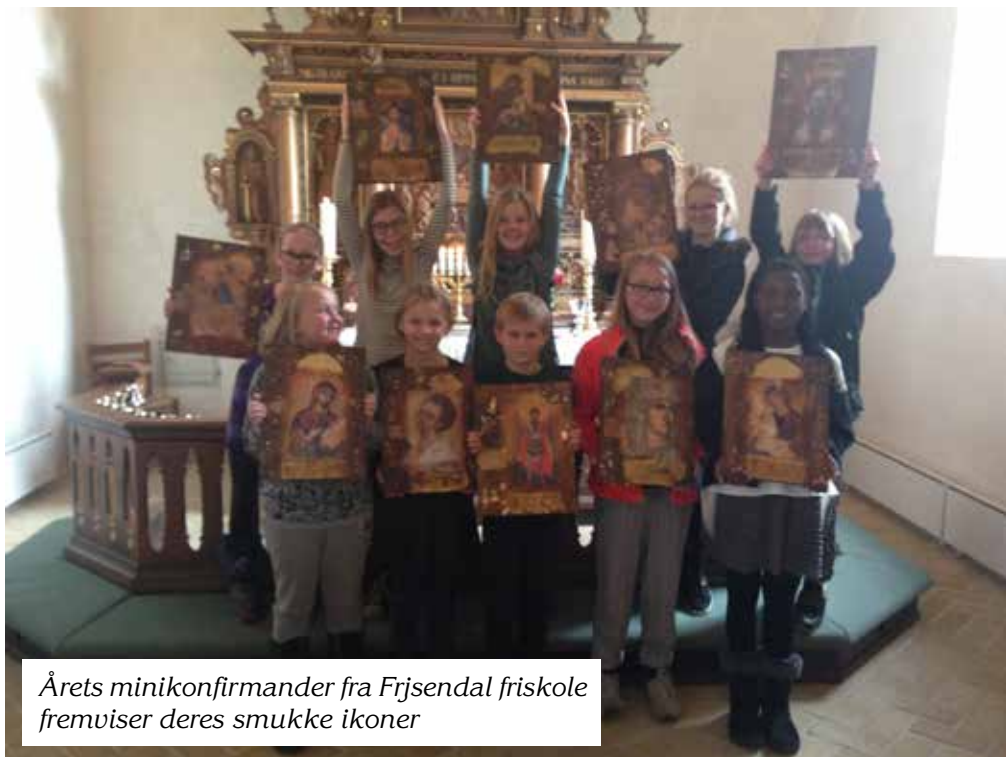
Årets minikonfirmander fra Frijsendal friskole fremviser deres smukke ikoner

I lige år, dvs. 2018 tilbydes undervisningen til børn fra Haurum og Sall sogne på 3. og 4. klassetrin. Familierne får direkte besked.