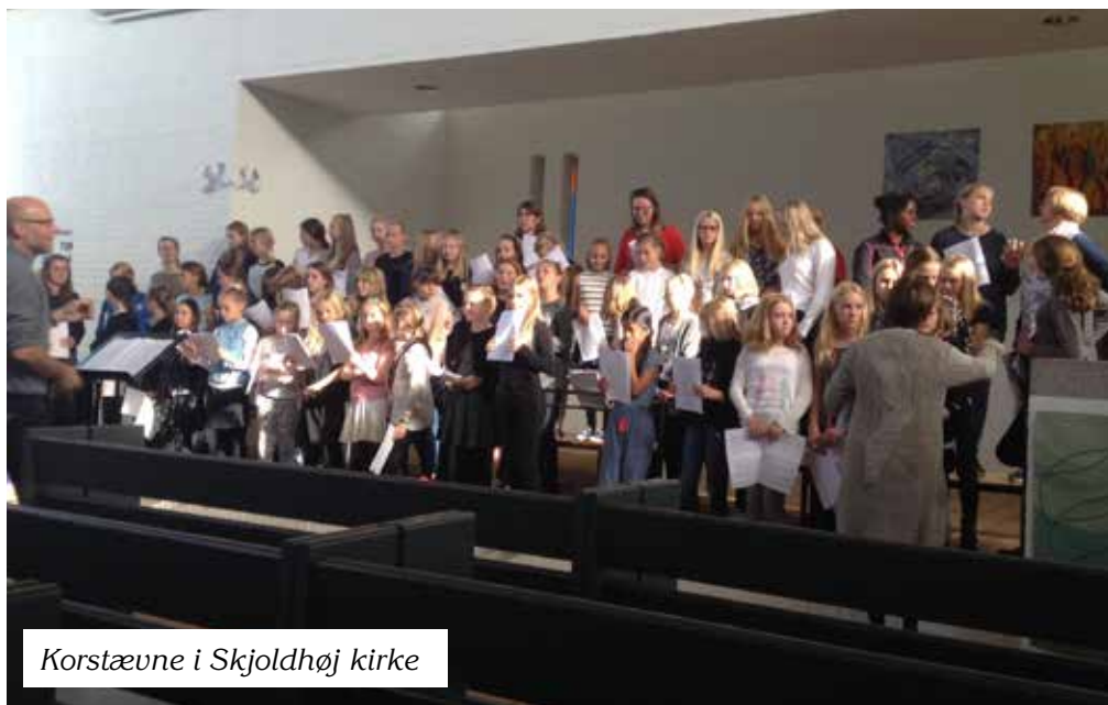
Korstævne i Skjoldhøj kirke

Løvsangerne har her i efteråret sunget til høstgudstjeneste i Værum - og ved Sognedagen i Granslev medvirkede Løvsangerne i gudstjenesten.